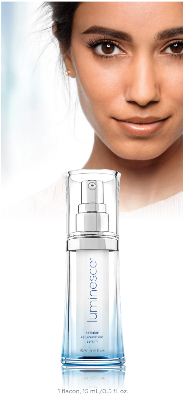
1 flacon, 15 mL/0,5 fl. oz.