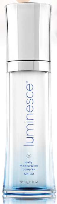
1 flacon, 30 mL/1 fl. oz.