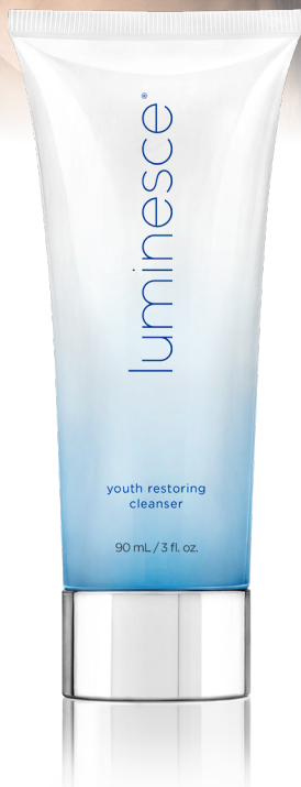
1 tube, 90 mL/3 fl. oz.