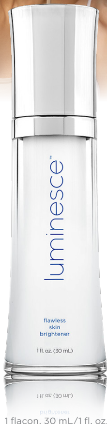
1 flacon, 30 mL/1 fl. oz.