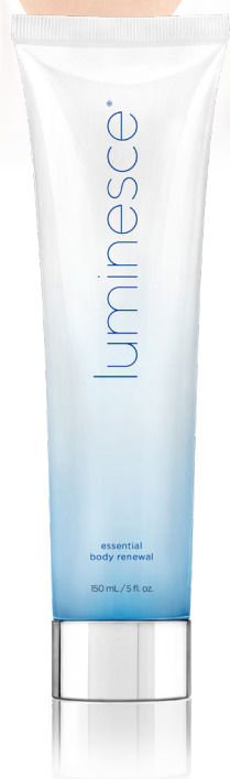
1 tube, 150 mL/5 fl. oz.