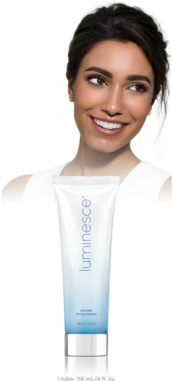
1 tube, 118 mL/4 fl. oz.